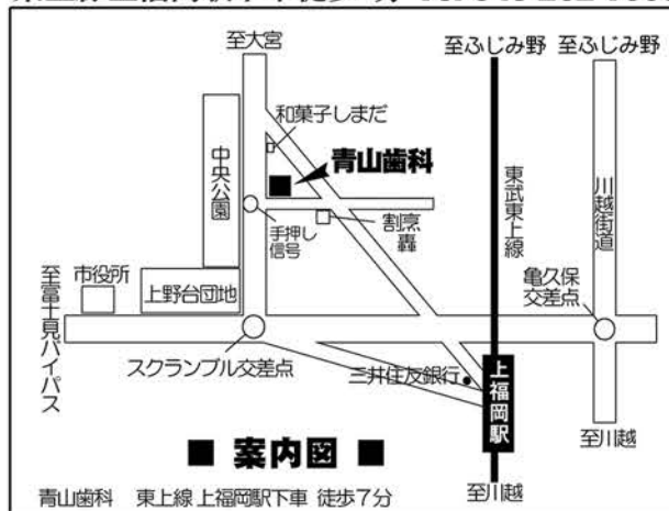
■ 案内図 ■

埼玉県ふじみ野市福岡中央 1-2-8 東上線 上福岡駅下車徒歩7分 Tel 049-262-1068